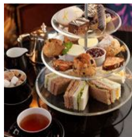
High Tea mmmh!